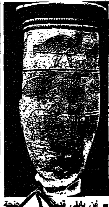
فن بيللي قديم عارية فوق مستهل الوجود